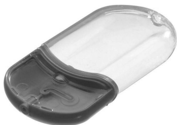
شکل ۳: پمپ مورد استفاده در اندازه‌گیری مقدار دارو [۱۷]

جوشکاری لیزر عبوری کاربردهایی گسترده به منظور اتصال پلاستیکی قطعات دارد. عمده‌ترین مورد استفاده از این نوع جوشکاری ساخت ابزار پزشکی از جمله تراشه‌های میکروفلوئیدیک و کاتتر است. تأکید ویژه این نوع کاربرد بر استفاده از لیزر به منظور نمونه برداری سریع و تولید تراشه‌های زیستی بوده، به ویژه برای مواردی که در آنها سیلیکون ماده پایه ترجیحی نباشد [۱۸]. در مهندسی پزشکی کاربرد این روش اتصال به عنوان یک فناوری تمیز در جوشکاری قطعات پلاستیکی مورد توجه بسیار قرار گرفته است. برای مثال در سیستم‌های تحویل دارو، به منظور کمک به بیماران در مدیریت مداوم مقدار داروها، از نوعی پمپ استفاده می‌شود که می‌تواند در مقدارهای گوناگون تنظیم شود (شکل ۳). در این ابزار به دلیل حساسیت بالای قطعات و نیاز به جوشکاری بدون اثرگذاری بر مواد تشکیل دهنده از این روش جوشکاری استفاده می‌شود [۱۹].